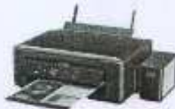
Multifuncional Epson EcoTank L455 Tanque...