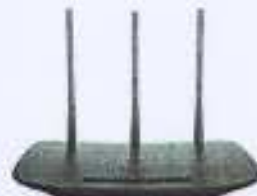
Roteador Wireless Tp-link TL-WR940N 450m...